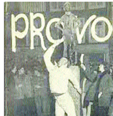
Happening de Provos.